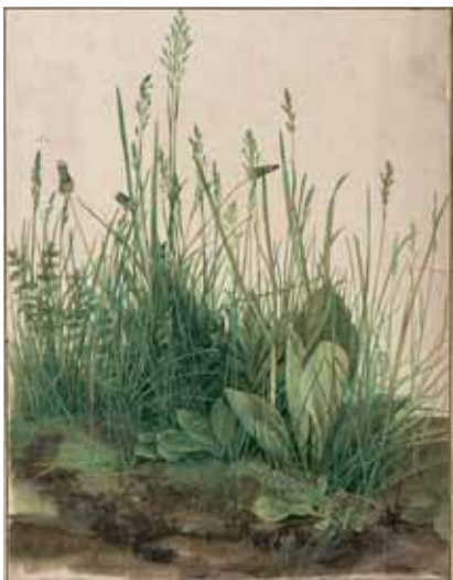
Albrecht Dürer, „Das Große Rasenstück“, Albertina, Wien

Format 100 x 70 cm produziert wird. Mit der von ihr entwickelten Technik, den Zeichenkarton u. a. dort zu wölben, wo die Wurzeln des Baumes zu denken wären, hat sie wieder Boden unter den Füßen gewonnen und diese Metapher im Titel deutlich gemacht. Andererseits drängen sich im Werktitel auch Bezüge zu Albrecht Dürer und seiner in Aquarell- und Deckfarben ausgeführten Naturstudie „Das große Rasenstück“ in der Albertina auf. Dürers Rasenstück ist nicht ein der Natur „entrissenes“ Pflanzenstück. Seine Naturstudie ist eine sorgfältig komponierte, eigenständige und autonome Arbeit, deren einzelne Gräser und Blumen von Dürer genau studiert und dann so zusammengestellt wurden, dass sie in ihrer Gesamtheit ein charakteristisches Bild einer für die Nürnberger Umgebung typischen Wiese ergeben. Zu Dürer hat die Künstlerin eine besondere Beziehung. Sie ist eine späte Nachfahrin Philipp Melanchthons, dem bedeutenden Gelehrten und Reformator an der Seite Martin Luthers. Dürer lernte Melanchthon im