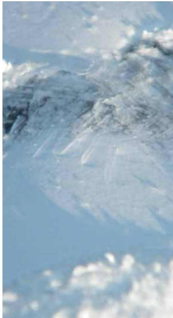
Einladungskarte Ausstellung Kreis Galerie Nürnberg „2000 bis 2010“